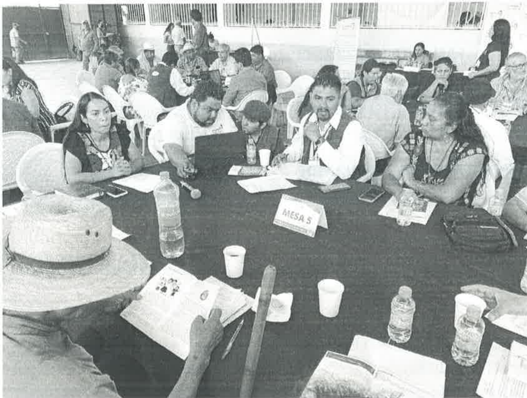
PERSONAS QUE INTEGRAN LA MESA DE TRABAJO DE LA REUNIÓN REGIONAL.