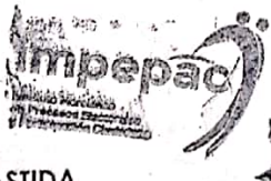
LIC. FELIPE ROMERO LABASTIDA

SECRETARIO DEL CONSEJO MUNICIPAL ELECTORAL DE TEPOZTLAN, MORELOS, DEL INSTITUTO MORELENSE DE PROCESOS ELECTORALES Y PARTICIPACIÓN CIUDADANA.